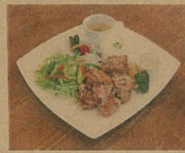
からあげ / ごはん / サラダ / スープ / ピクルス