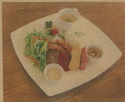
Wing 2 / たまご焼 / ウィナー / 小金太 / ごはん / サラダ / スープ / ピクルス