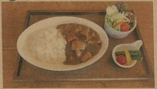
いちじくカレー / サラダ / ピクルス