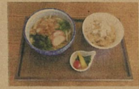
うどん / たまごごはん / ピクルス